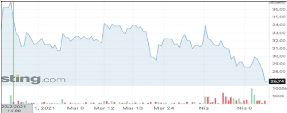
Tablo 3: Dardanel Markasının 23.02.2021 – 15.04.2021 Tarihleri Arasındaki Borsa Grafiği

Kriz doğrultusunda Dardanel'in Twitter üzerinden paylaştığı basın bültenine 1000'i aşkın yorum yapılmıştır. Yorumların büyük çoğunluğu olumsuz ifadelerden oluşmaktadır. Denetlecom hesabından Twitter'da paylaşılan video 1,9 milyondan fazla izlenmiş ve 1300'ü aşkın yorum yapılmıştır, yorumların büyük çoğunluğu olumsuz duygu ve görüşlerden oluşmaktadır. Twitter üzerinden Birgün gazetesinin paylaştığı gönderi 1 milyondan fazla izlenmiş ve 1000'i aşkın yorum yapılmıştır, yine yorumların büyük çoğunluğu olumsuz duygu ve görüşlerden oluşmaktadır. Ayrıca çevrim içi ortamda hem büyük hem küçük çaplı 22 farklı haber sitesinden kriz haber konusu olmuştur. Kriz gününden sonra Dardanel'in piyasa değeri Tablo 3'te görüldüğü gibi düşmeye başlamıştır. Krizden bir gün önce 36 TL olan hisse senedi, dalgalanmalar olsa dahi sürekli düşüşe geçmiştir ve bugün (13.04.2021) 26 TL seviyelerinde işlem görmektedir.